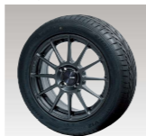
ENKEI PerformanceLine PF03