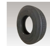
交換用国内タイヤ