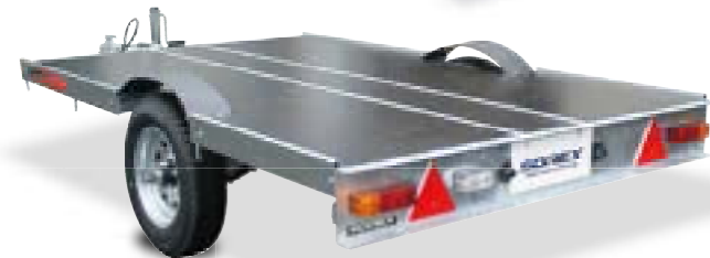
NF-1 LOW STYLE