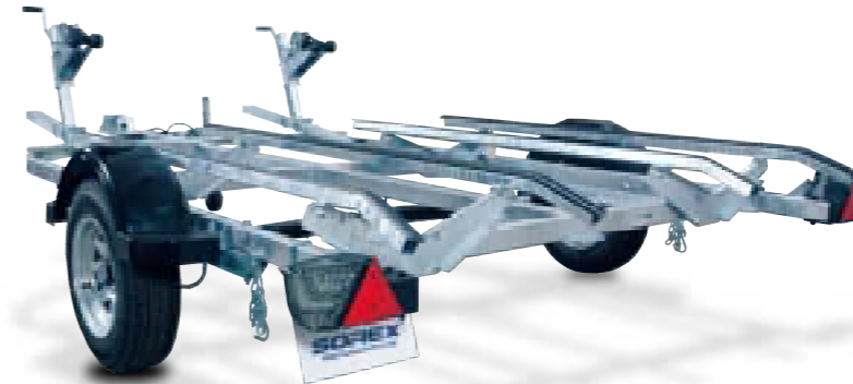
TWIN JET 1150

より強固な溶接フレームのツインジェット1150とツインジェット1150と同フレームになったツインジェットSWKの誕生。