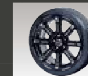
17インチアルミホイール