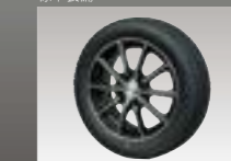
ブリヂストン製 15インチ標準アルミホイール ※500S